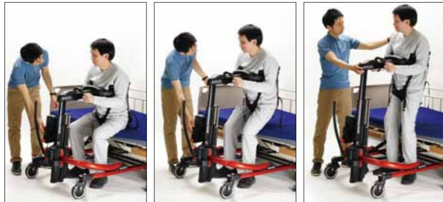
写真は歩行用サドル（オプション）を装着しています。