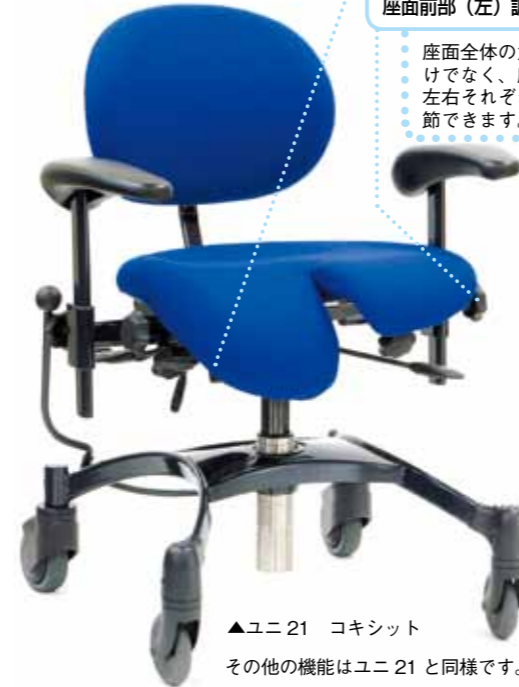
▲ユニ 21 コキシット その他の機能はユニ 21 と同様です。