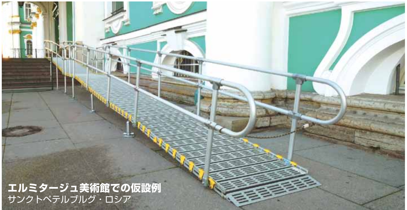
エルミタージュ美術館での仮設例 サンクトペテルブルグ・ロシア