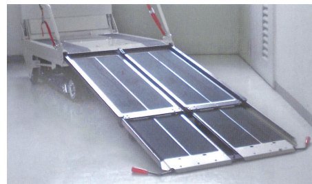
▲引き出し式スロープ